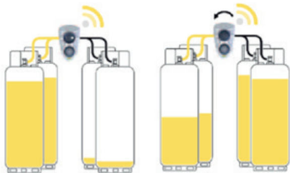
Switch naar reserve

Het systeem bestaat uit 2x2 geschakelde propaanflessen van 10,5 kg per stuk, die aan elkaar zijn gekoppeld. Is de ene groep gasflessen leeg, dan schakelt het systeem automatisch over naar de volgende groep. Overschakeling wordt, door middel van telemetrie in de schakelunit, automatisch geregistreerd en online gemeld. Uw gasleverancier plant vervolgens een afspraak om de lege flessen te verwisselen voor volle. Dankzij dit systeem kunt u onbezorgd van uw gashaard blijven genieten.