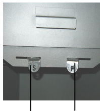
Secondary air controller (S) Primary air controller (P)

The primary air controller (P) is located on the right-hand side of the loading door and the secondary air controller (S) is located on the left-hand side beneath the loading door.