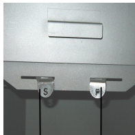
Secundaire luchtregelaar (S) Primaire luchtregelaar (P)

De primaire luchtregelaar (P) bevindt zich rechts en de secundaire luchtregelaar (S) links onder de vuldeur.